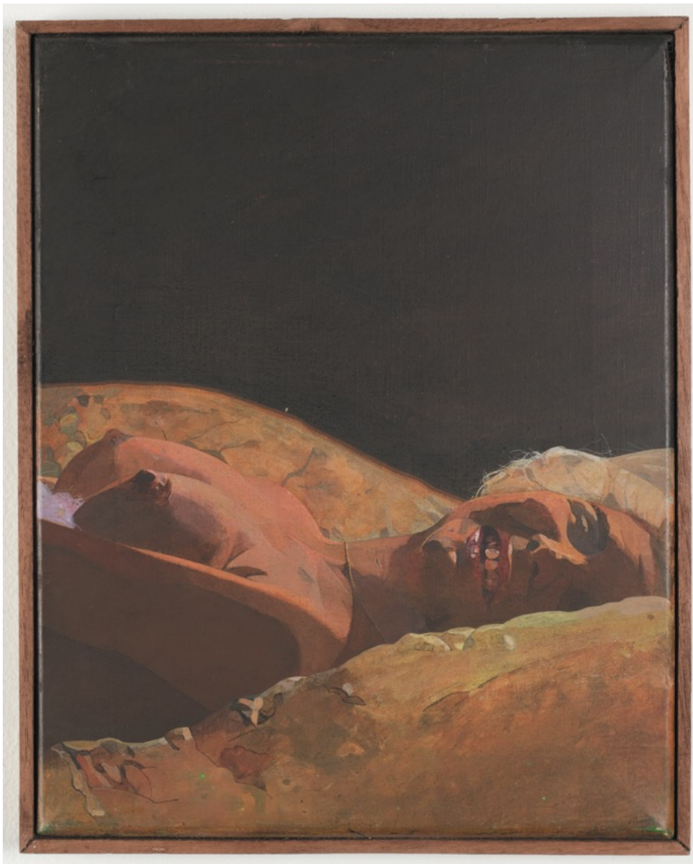
Pin-up Girl 1965

Acrilico su tela Cm 25,4 x 20,3 Firmato, datato e titolato