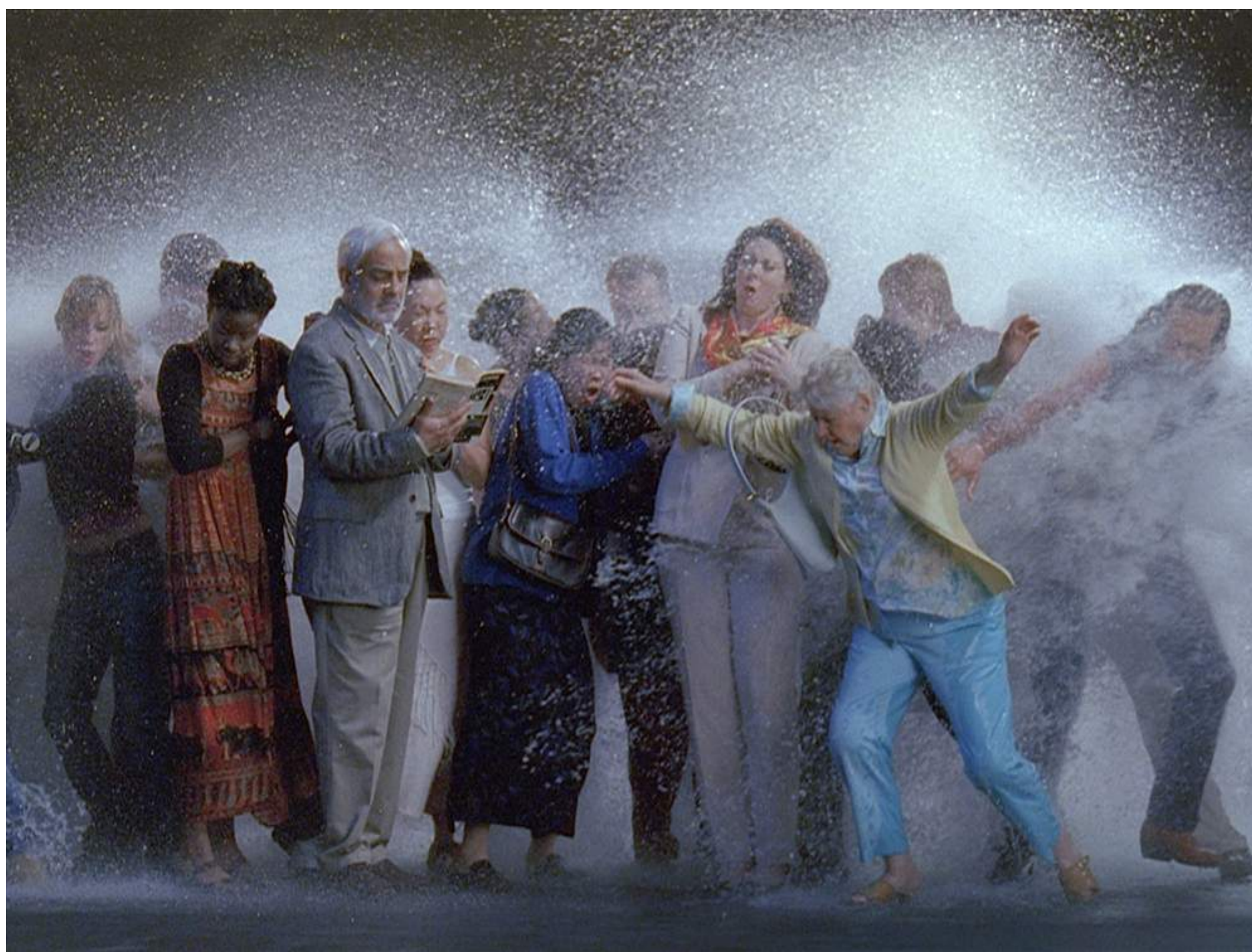
«Tempest. Study for The Raft» (2004), di Bill Viola, presso lo Studio Giangaleazzo Visconti

A Milano nello storico Palazzo Cicogna, divenuto una sorta di distretto d'arte, inaugurano contemporaneamente otto gallerie