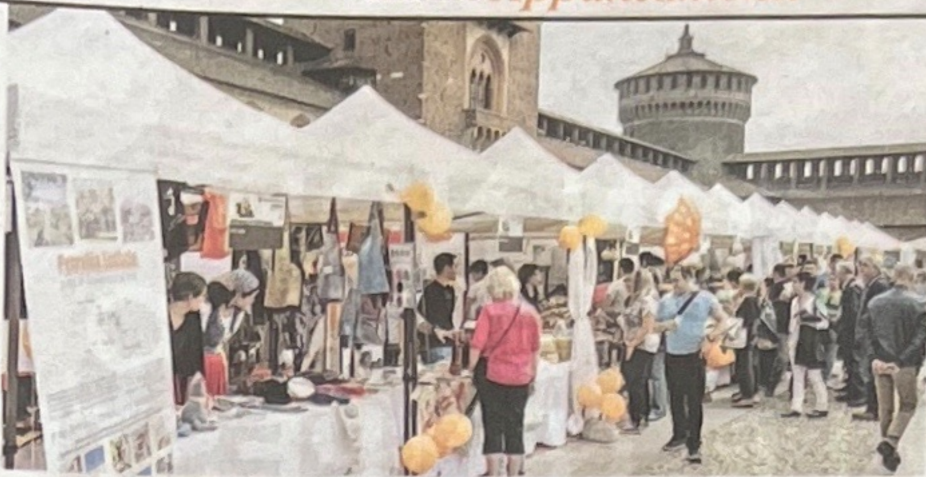
Al Castello Sforzesco