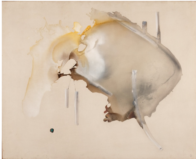
Enrico Donati, Barometro , 1951-52