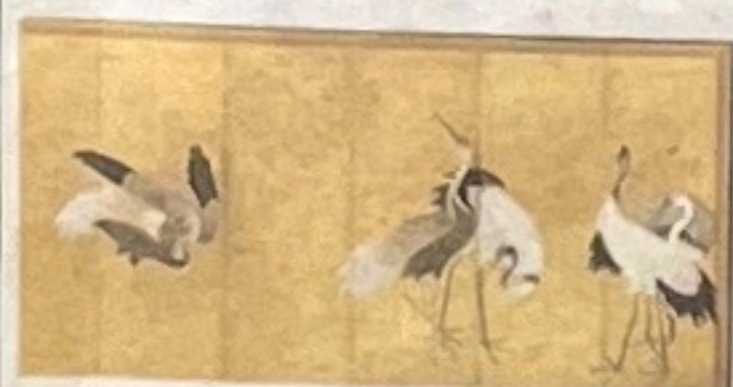
▲ Capolavori dal Giappone

Salamon Gallery presenta un polittico riassembleto del pittore fiorentino trecentesco An-